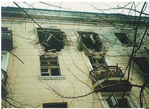
Рис. 5. После взрыва в доме

Печальная статистика жертв террористических актов не обошла и нашу страну. До распада СССР и обострения национальных конфликтов терроризм в нашей стране был весьма редким явлением. Единственный нашумевший случай в 1970-х гг. - это взрыв в вагоне московского метро в январе 1977 года, который унес более десяти жизней. Начиная с начала 1990-х гг. ситуация кардинально изменилась.