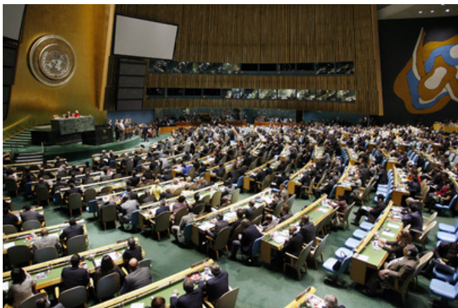
Рис. 9. Страны ООН - против терроризма

Сегодня на первый план выдвигается борьба против международного терроризма, который стал главной угрозой жизни и здоровью людей, а также стабильности мировой экономической и политической систем. Активные шаги в этом направлении проводятся на различных уровнях. На уровне глав государств и правительств, спецслужб, вооруженных сил, политических и общественных организаций и движений.