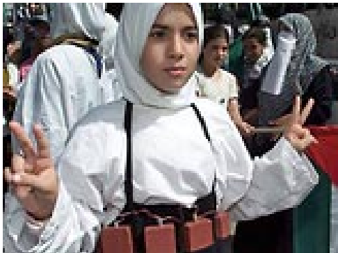
Рис. 12. Она готова стать террористкой

Непосредственную работу с потенциальным шахидом проводят «штатные» психологи террористических организаций.