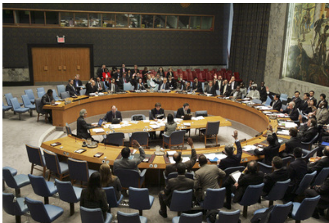
Рис. 10. Совет безопасности обсуждает проблему противодействия терроризму

Департамент по вопросам разоружения (ДВР) занимается созданием и ведением единой базы данных по биологическим инцидентам, которая содержит детальную информа-