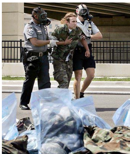
Рис. 13. Оказание помощи после взрыва

Необходимо помнить, что метро (помещения, вагоны) – это замкнутые пространства. Во-первых, здесь затруднены, а порой, невозможны свободные перемещения вследствие давки из-за паники, остановки поезда в тоннеле и т.п. Во-вторых, взрыв в замкнутом пространстве гораздо опаснее, чем на открытом воздухе, так как взрывной волне, образуемой давлением распространяющегося газа, некуда уходить, и она причиняет гораздо больше вреда, чем на открытом пространстве.