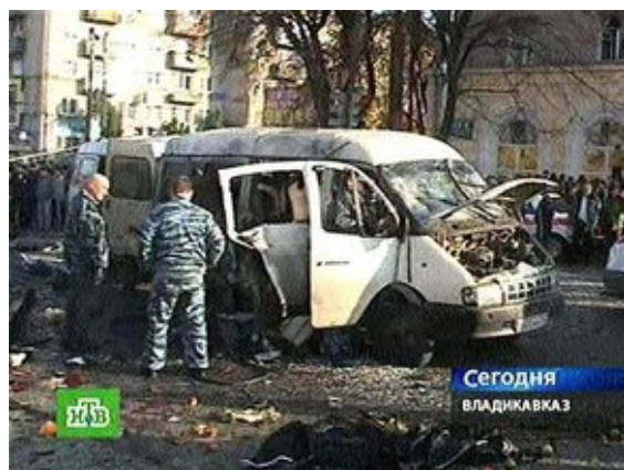
Рис. 7. Взрыв маршрутного автобуса

действие взрывное устройство мощностью до двух килограммов в тротиловом эквиваленте. 10 человек погибли, более 50-и получили ранения.