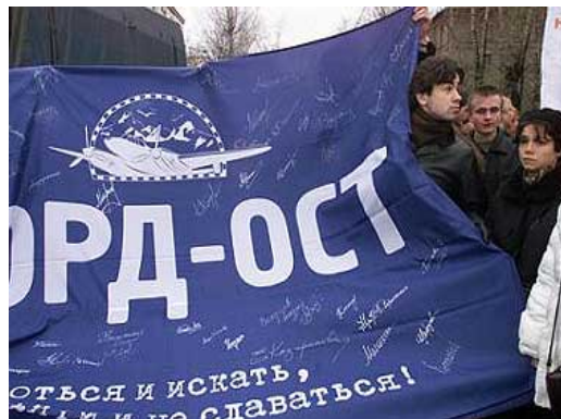
Рис. 6. Люди осуждают террористов

2004, 31 августа рядом со станцией метро «Рижская» террористка-смертница привела в