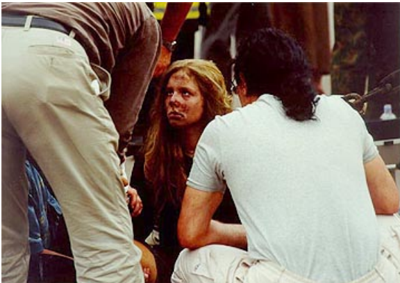
Рис. 2. Сразу после теракта

Отвечая на поставленный вопрос, необходимо подчеркнуть, что терроризм не есть что-то беспричинное или коренящееся в дефектах биологической природы человека. Это - явление, прежде всего, социальное, имеющее корни в условиях социального бытия людей. Именно здесь содержатся истоки потенциальных проблем и