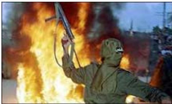
Рис. 4. Современный облик терроризма

Сегодня наблюдается резкий всплеск и качественные преобразования терроризма. Терроризм значительно расширил свою географию, охватил Латинскую Америку и Азию. Он обрел черты наступательности, высокой технической оснащенности, отличается изощренностью и жестокостью.