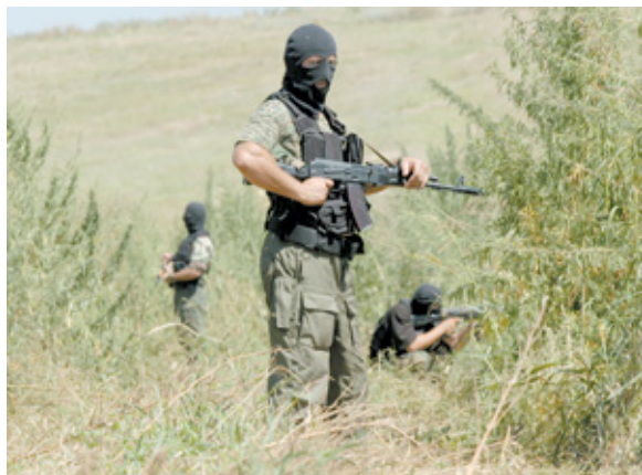
Рис. 11. Специальное подразделение проводит контртеррористическую операцию

На антитеррористические комиссии возлагаются функции координации деятельности территориальных органов исполнительной власти и органов местного самоуправления по профилактике терроризма, а также по минимизации и ликвидации последствий его проявлений. Комиссии возглавляют высшие должностные лица субъектов Российской Федерации.