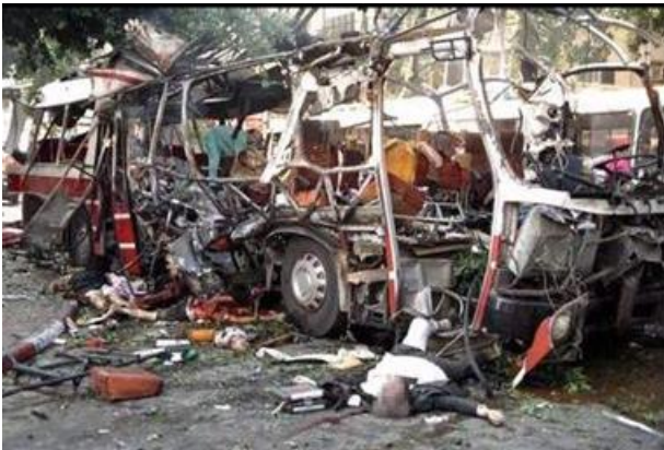
Рис. 3. Взрыв автобуса с людьми в Израиле

- политические похищения, имеющие целью добиться определенных политических условий, освобождения из тюрьмы сообщников и т.д.;