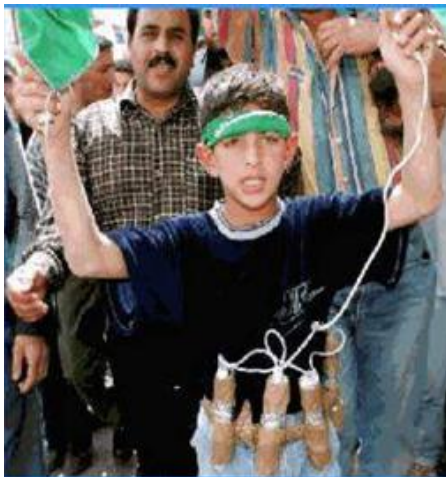
Рис. 8. Он уже готов проститься с жизнью («пушечное мясо» главарей терроризма)

б) людей неквалифицированных в профессиональном плане, но имеющих те или иные причины примкнуть к террористам (идеологические, материально-бытовые, стремление избежать уголовной ответственности за совершенные ранее преступления, отомстить за что-то властям). Эта категория представляет «пушечное мясо», рассчитанное либо на одноразовое использование, либо на непродолжительный срок пребывания в рядах террористов.